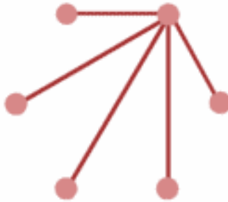
Topologie en étoile

Ce type de réseau est très employé, car efficace et peu coûteux. Tous les éléments sont reliés à un point central. Si un hôte tombe, seul celui-ci tombe, par contre si un élément central tombe, tout le réseau tombe.