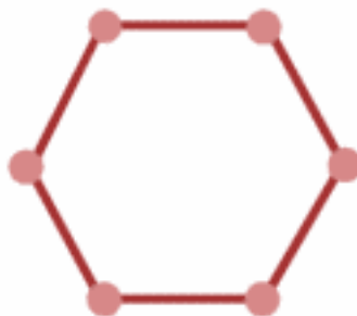
Topologie en anneau

Une topologie en anneau ressemble assez à une topologie en bus, sauf qu'elle n'a pas de fin ni de début, elle forme une boucle. Quand un paquet est envoyé, il parcourt la boucle jusqu'à ce qu'il trouve le destinataire. Il existe soit la topologie en anneau simple soit la topologie en double boucle(FDDI), qui permet une redondance et qui comme son nom l'indique est formé de deux anneaux.