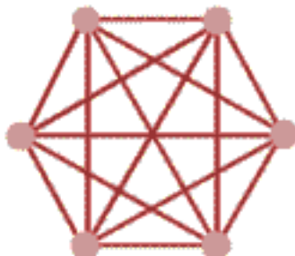
Topologie point par point

Cette topologie consiste à relier chaque point l'un à l'autre, ce qui implique un cout extrêmement élevé. Cette topologie n'est pas utilisée en pratique, mais c'est sur une topologie pareille qu'est basée internet. C'est la technologie la plus sûre.