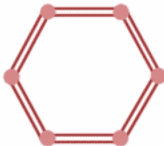
Topologie en double anneau